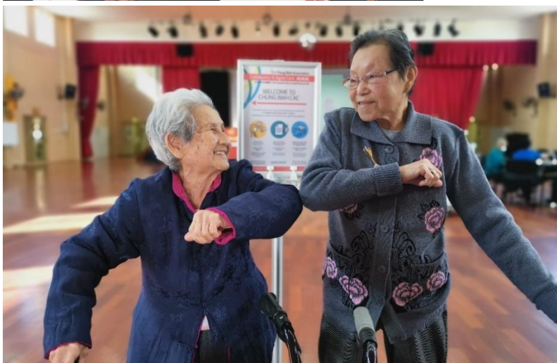
(Bà Lim đã 'khuỷu tay' bà Soh như một lời tạm biệt trước khi về nhà)