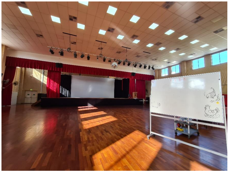
(Hội Chung Wah tháng 6, 2020)

Mặc cho các tất cả những khó khăn do COVID-19, các nhân viên của công ty CAC đều cùng quyết tâm để cung cấp các dịch vụ hỗ trợ tốt hơn, tạo ra nhiều chương trình giải trí mang tính giáo dục hơn cho các cao niên và người tham gia NDIS. Chỉ còn hơn một tuần nữa là đến ngày CAC mở cửa Hội Balcatta (thứ Hai ngày 6 tháng 7 năm 2020), các đội ngũ nhân viên của chúng tôi đang bận rộn chuẩn bị để chào đón sự trở lại của các khách hàng thân thương. Nếu bạn muốn tới tham dự trung tâm, xin vui lòng gọi cho nhân viên của công ty chúng tôi hôm nay. Chúng tôi mong sẽ sớm được gặp bạn!