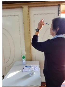
(Kiểm tra nhiệt độ cơ thể)