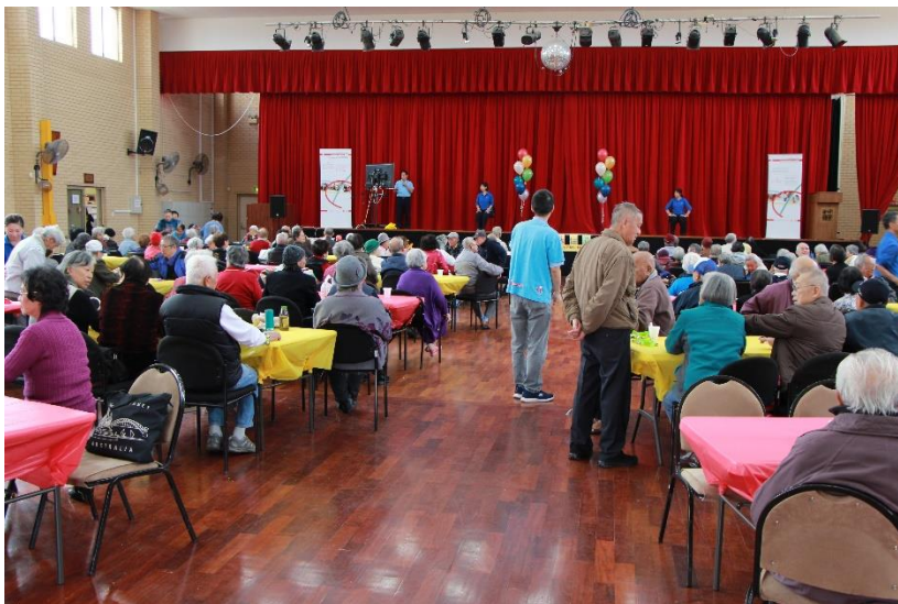
(Sự kiện Lễ Hội Thuyền Rồng tháng 6, 2019)