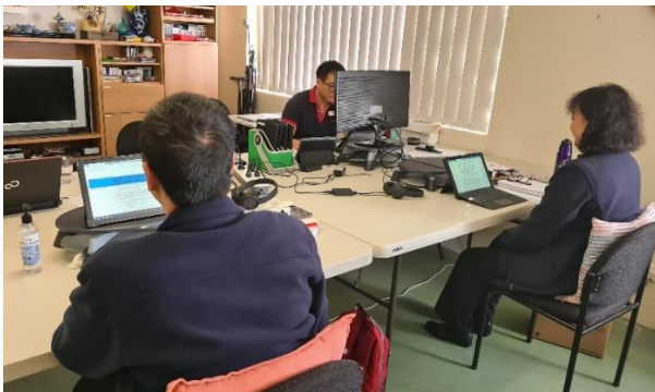
(Giữ khoảng cách xã hội)